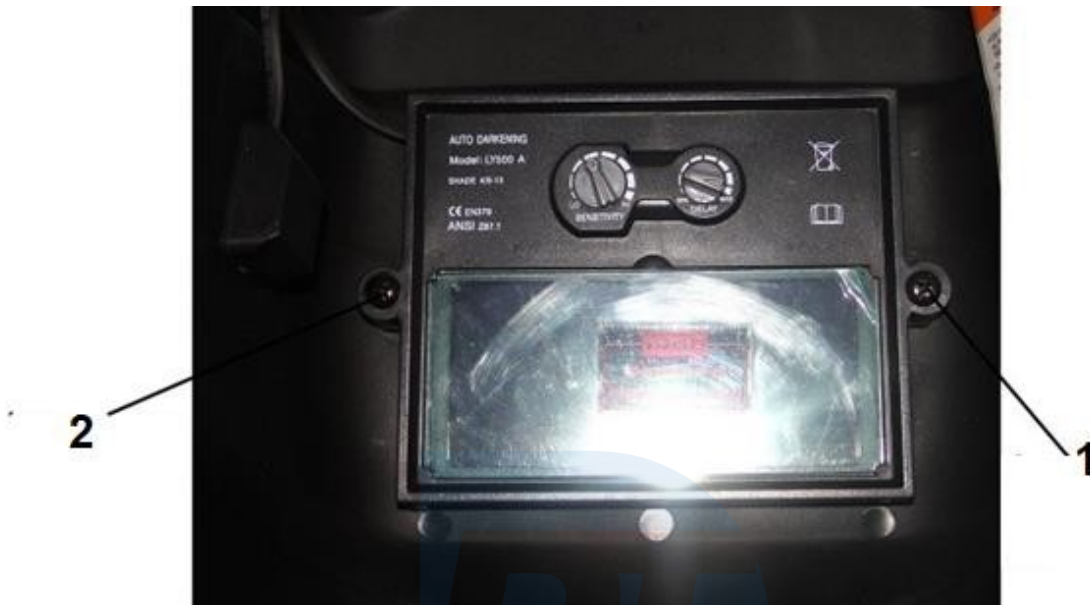
1. Szűrőkeret rögzítő csavar 2 . Szűrőkeret rögzítő csavar

A külső burkolat a keretet rögzítő 2 csavar kicsavarásával cserélhető ki. A keret meglazítása után fel kell emelnie a teljes szűrőt, amely alatt az elülső szűrőfedél található.